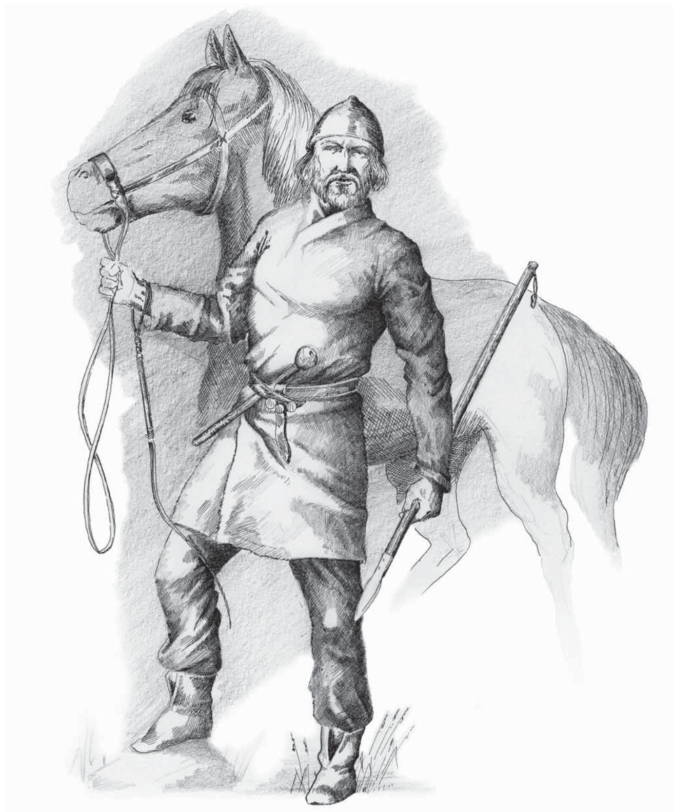
Рис.3. Могильник Майтан. Внешний вид мужского костюма. (художник Д.А. Белоногов)