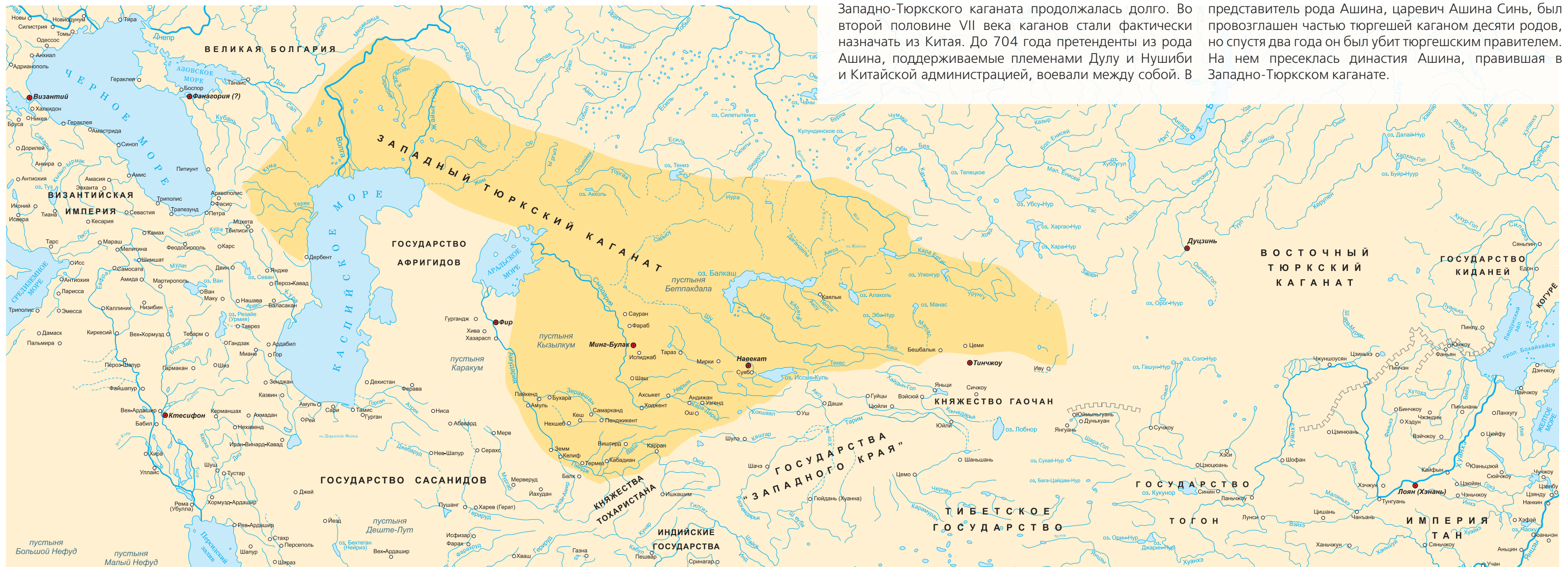
Западно-тюркский каганат, начало VII века

Спустя 5 лет, в 704 году, он умер в Чанъани, столице средневекового Китая. После него двумя «каганами в изгнании» считались Ашина Хуайдао (числился правителем в 704-708 годах) и Ашина Хянь (числился правителем в 708-717 годах). В 740 году последний представитель рода Ашина, царевич Ашина Синь, был провозглашен частью тюргешей каганом десяти родов, но спустя два года он был убит тюргешским правителем. На нем пресеклась династия Ашина, правившая в Западно-Тюркском каганате.