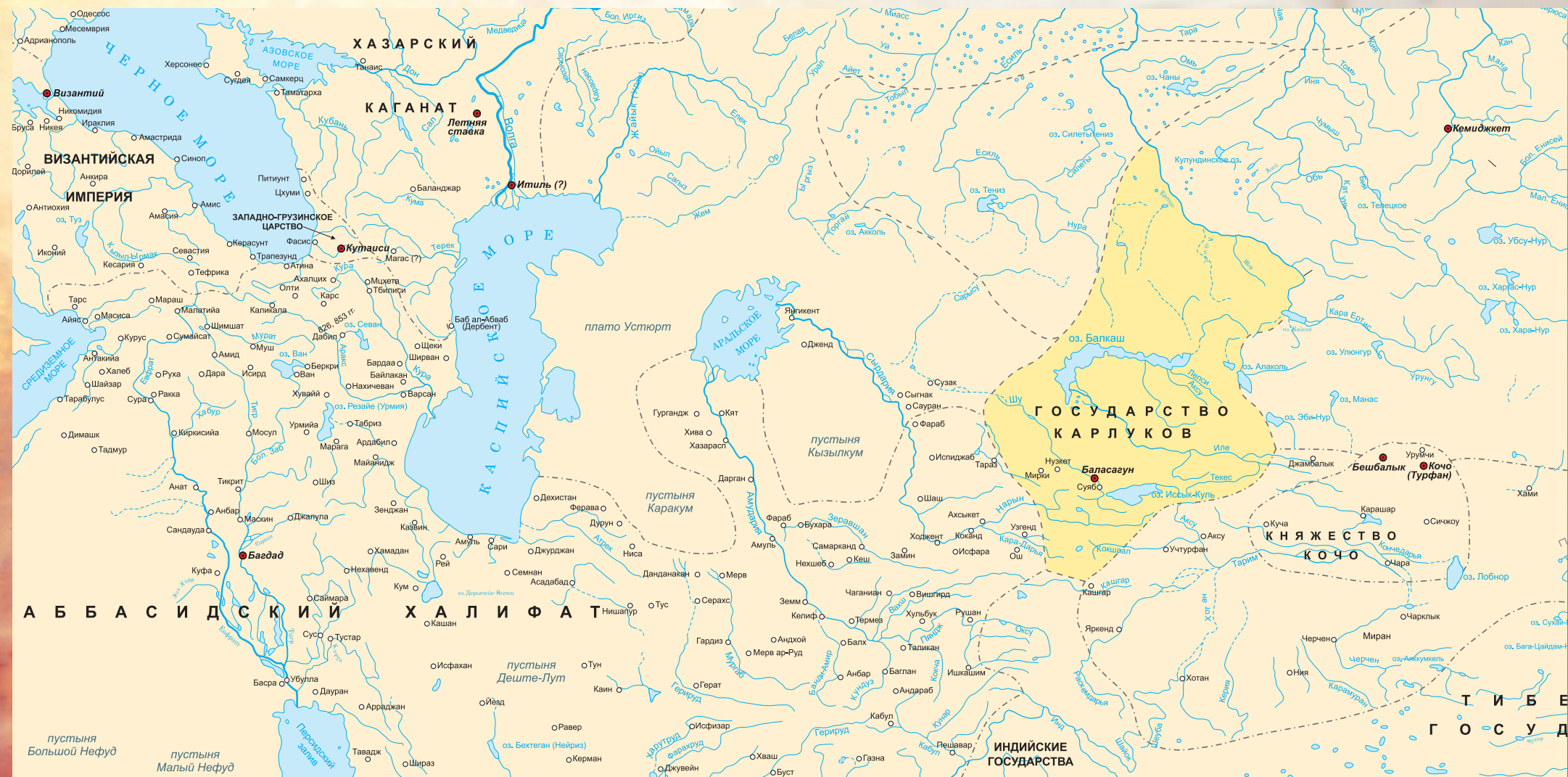
Государство Карлуков, вторая половина IX века

одним из тюркских начальников. [Эти тюрки] переходили с места на место; мать Халлуха сидела на лошади. Место было пустынным; один из слуг Халлуха подошел к матери Халлуха, хотел овладеть ею и схватил ее; женщина его прогнала с угрозами; известно, что тюркские женщины очень нравственны. Увидя это, слуга испугался, убежал и пришел в страну тугузгузов, во владения хакана. Один из людей хакана нашел его в месте охоты, в суровой местности, прикрытого двумя кусками войлока; он дал ему имя Ябагу. Потом он привел его к хакану;