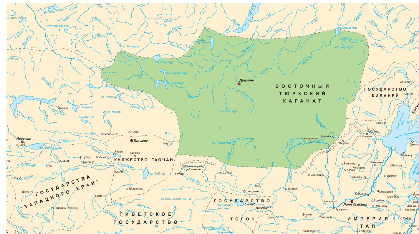
Восточный- тюркский каганат, начало VII века

После смерти трех великих политических деятелей возрожденного Тюркского Каганата (Бильге-каган, Тоньюкук, Кюль-тегин) государство стало катиться к упадку. В 742 году коалиция трех племен карлуков, бысмылов и уйгуров подняла восстание и в 745 году свергла последнего тюркского кагана по имени Баймэй-каган.