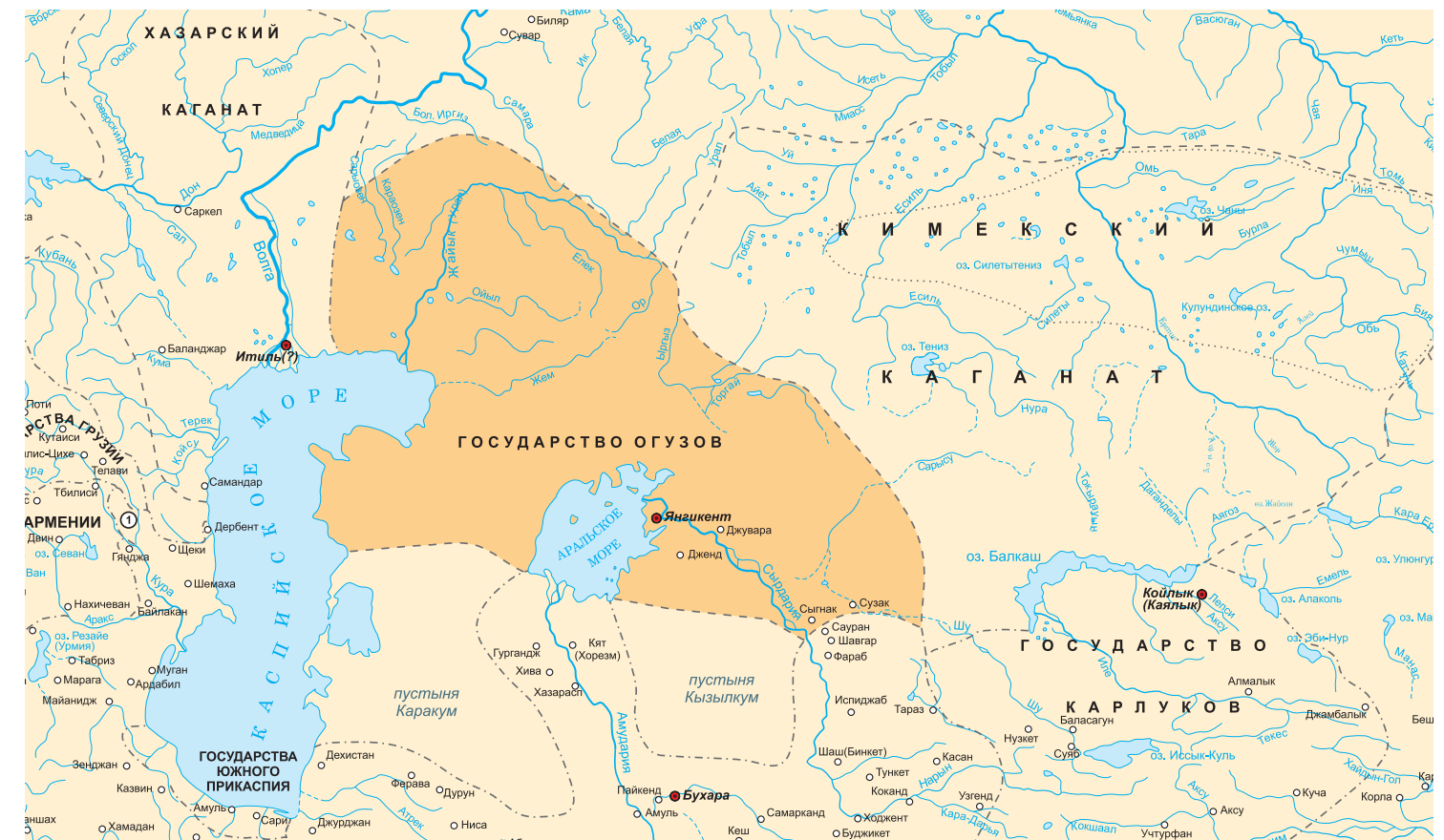
Государство Огузов, X век

переселения кыпчаков, огузы разделились на две части. Одна часть огузов ушла на запад, в Причерноморье, где стала известна в русских летописях под названием гузы, другая часть ушла в Среднюю азию и Ближний восток, где стала известна под названием туркмены, турки, сельджуки. Распад государства огузов был осложнен как вторжением кыпчаков, так и военным противостоянием огузского Джабгу и огузов Сельджуков. Падение огузской державы привело к миграциям огузов к сельджукам, которые происходили из племени Кынык и начали завоевание Ближнего востока. Огузы являются в той или иной мере предками туркмен, турков, азербайджанцев и гагаузов.