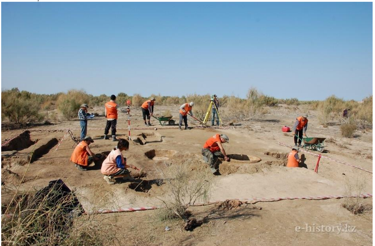
Раскоп. Рабочий момент

Из значительных по размерам и довольно хорошо сохранившихся построек на рабаде городища можно выделить каравансарай, центральная постройка которого имеет размеры 30x25 метров.