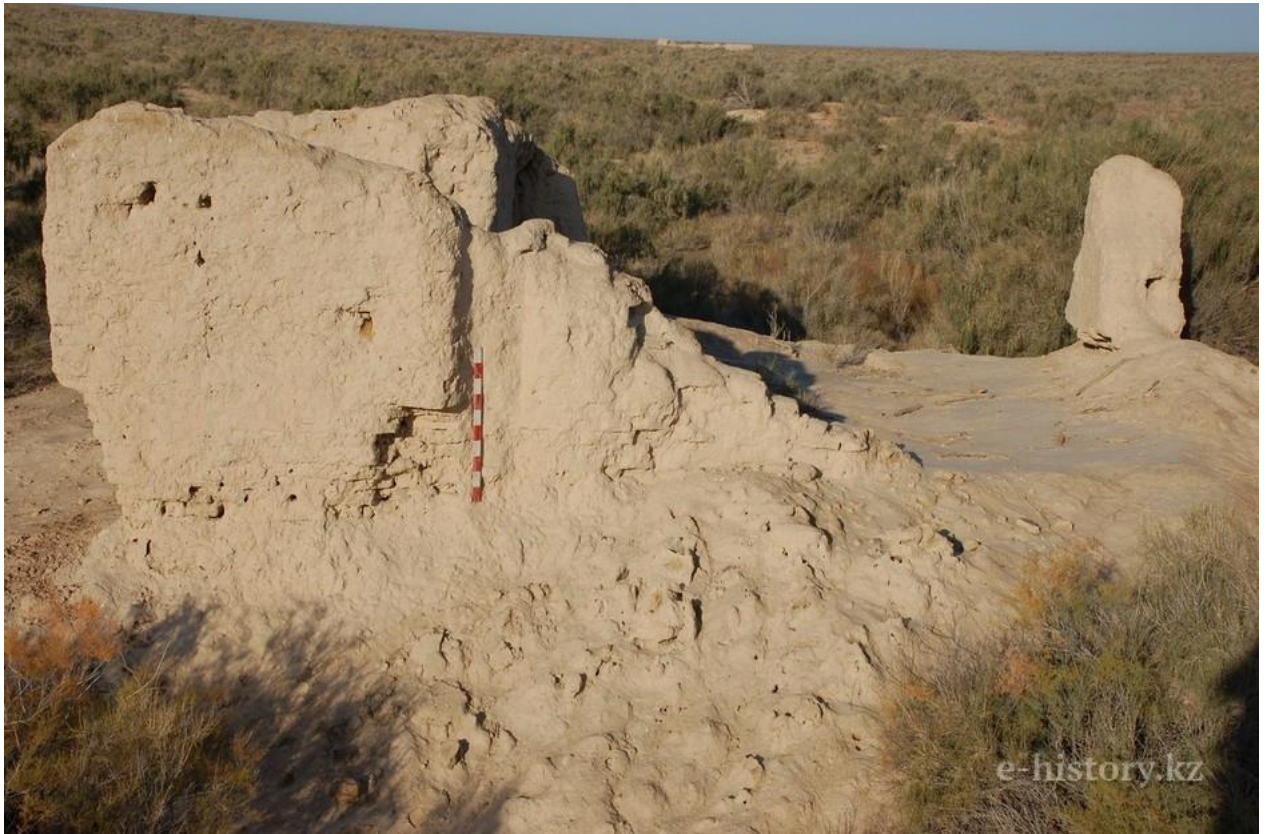
Развалины одной из усадеб Джан калы

Ирригационная система городища базировалась на магистральном канале, выведенном из Жанадарьи. Линия канала тянется в западном направлении, при этом, не достигая границ городища, распадается на три-четыре больших канала второго порядка. Один из них пересекает шахристан, разделяя его при этом на две части: северную и южную. На территории шахристана, в его западной части, на этом же канале построен распределитель, дающий разветвление еще трем каналам, снабжающим водой западную часть рабада.