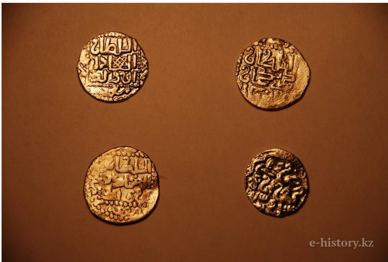
Монеты Джан клы

Все медные монеты, которые возможно определить, относятся ко времени правления Узбека и Джанибека (1330-1350-е гг.). Важно отметить следующее: отсутствуют монеты домонгольского времени, и очень высока доля серебряных монет в комплексе; около 10 медных монет приходится на 1 серебряную. Все монеты относятся ко времени расцвета Улуса Джучи (время ханов Узбека и Джанибека), при этом значительно преобладают монеты, выпущенные в 1340-е гг. В комплексе имеются монеты с обозначением нижеволжских мест чекана - Сарай и Сарай ал-Джедид.