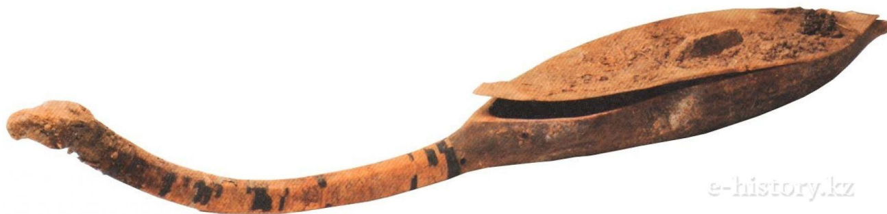
Рисунок 12. Музыкальный инструмент половец (Украина)