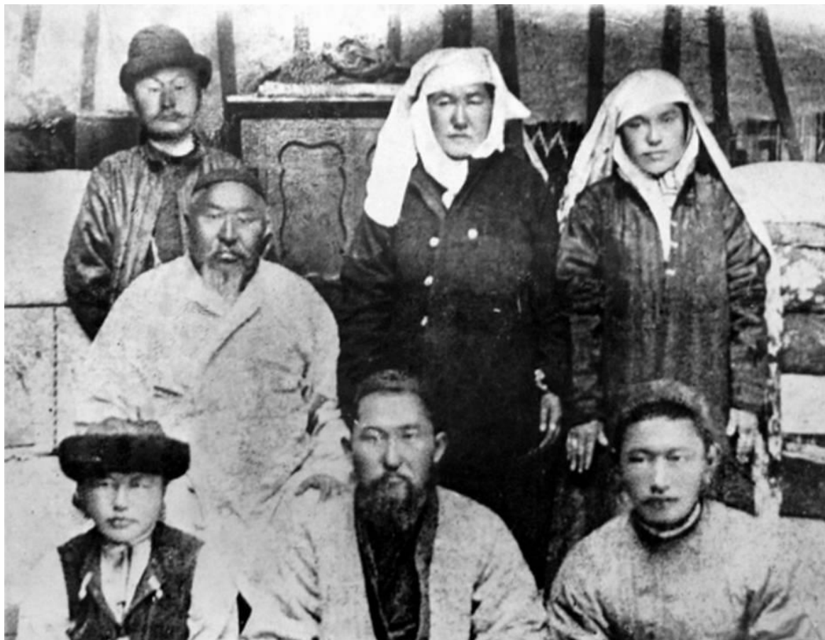
Ұлы ақынның отбасы

уәжіне ойланып қалған Қаратай: «Ақылды сөзге арсыз дес бермейді, карағым Абай, көңіліңе алма, сөзіңнің қисыны бар!» – деп оң шырай танытыпты дейді.