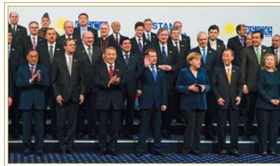
Саммит ОБСЕ. Астана, 2 декабря 2010 года

Президент РК выступил с лекцией «Инновационная индустрия науки и знаний – стратегический ресурс Казахстана в XXI веке» в «Назарбаев Университете». «Нам сегодня необходима своя индустрия науки и знаний, способная самостоятельно готовить профессионалов международного уровня. Для нашей системы образования необходим эталон высшего учебного заведения XXI века. В предыдущие годы государство многое сделало для развития всей системы об-