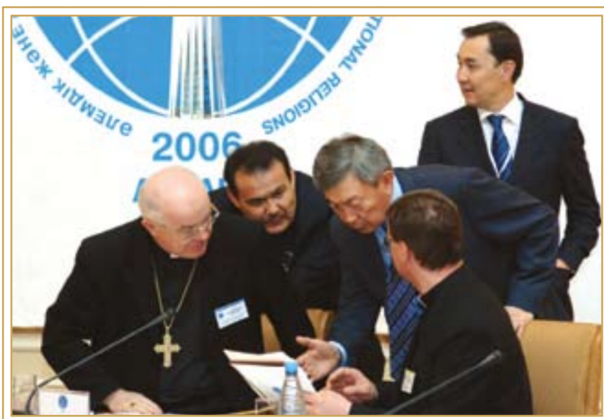
Заседание секретариата Съезда мировых религий. Астана, 26 апреля 2006 года