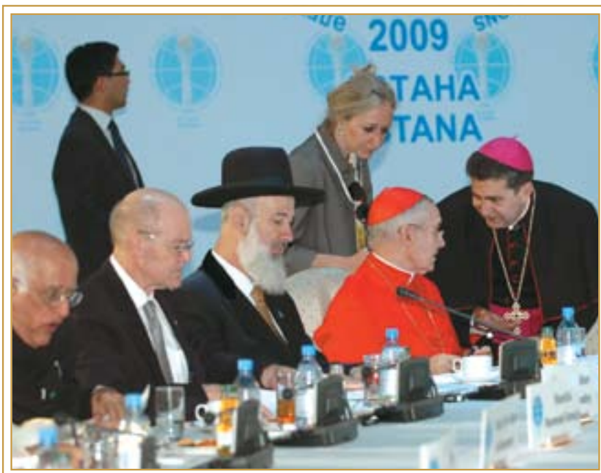
Участники III Съезда лидеров мировых и традиционных религий за работой. Астана, 1 июля 2009 года