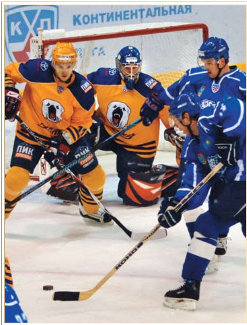
Команда «Барыс» – участник чемпионата КХЛ. Астана, сентябрь 2009 года

взятку в размере 30 тысяч тенге за вынесение положительного решения о выделении земельного участка под строительство индивидуального жилого дома. Не имея денег, селянин дал акиму двух баранов. Но тот потребовал от него принести еще 14 тысяч тенге. Мужчина обратился к финансовым полицейским и вскоре меченые купюры попали в руки земельного инспектора, выступившего в роли посредника. Когда же взятка оказалась у акима, сотрудники финпола задержали его за получение незаконного вознаграждения, не забыли они и о земельном инспекторе, который был привлечен к ответственности за посредничество.