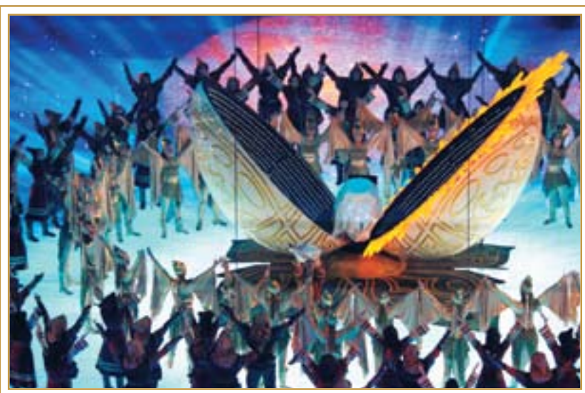
Театрализованная постановка зимней Азиады. Астана, 30 января 2011 года