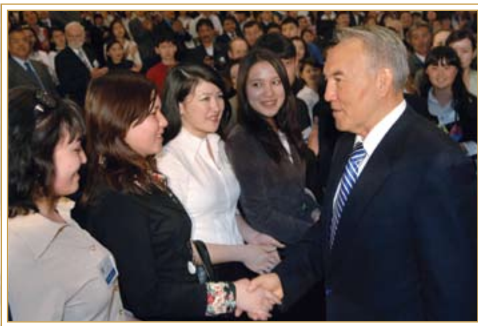
После лекции в Евразийском национальном университете им. Л.Н. Гумилева. Астана, 26 мая 2006 года