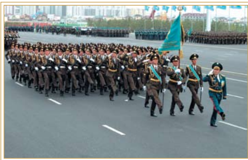
Вооруженные Силы РК на военном параде. Астана, 30 августа 2010 год