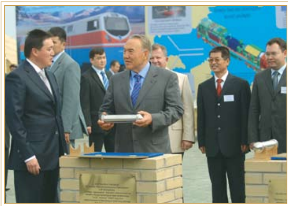
Закладка капсулы на месте строительства локомотивного завода. Астана, 3 июля 2007 года

В парке Победы села Актогай Павлодарской области в честь 100-летия переселения болгар на казахстанскую землю была посажена Аллея Дружбы.