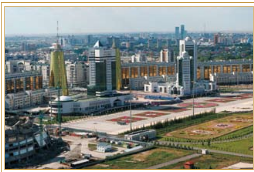
Астана – столица независимого Казахстана. Июль 2009 года

нию Главы государства, выступившего на III Съезде лидеров мировых и традиционных религий, нынешний кризис дал миру уникальный шанс преобразиться, реализовать извечную мечту человечества о справедливом миропорядке. И этот шанс было бы непростительно упустить.