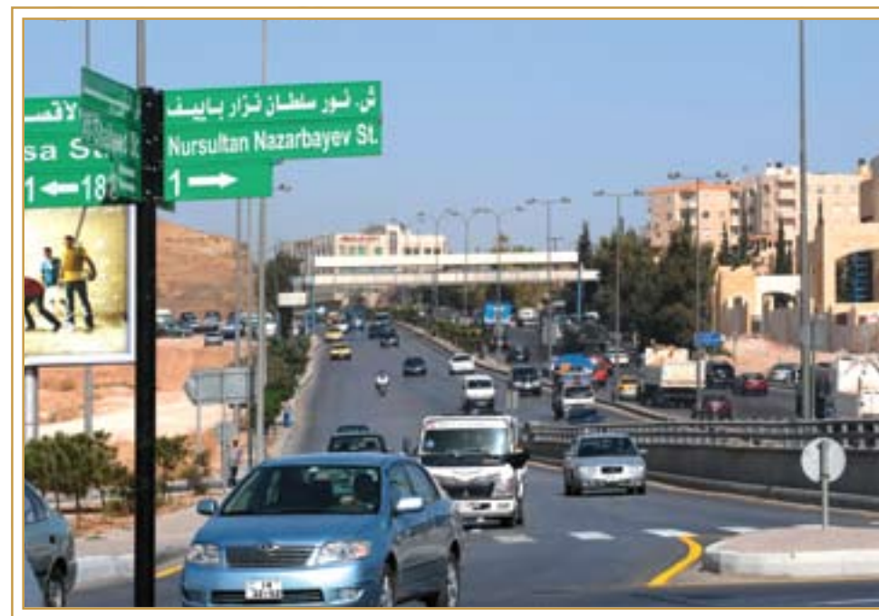
Улица им. Н. Назарбаева. Амман (Иордания), 21 июня 2010 года

Казахский национальный университет искусств в Астане официально переехал в новый «дом»: им стал Дворец творчества «Шабьт», расположенный на левобережье столицы, рядом с монументом «Қазақ елі» и Дворцом Независимости. Первым поздравить КазНУИ с новосельем вчера прибыл Глава государства Нурсултан Назарбаев, при чьей непосредственной поддержке создавался уникальный вуз. Поздравляя студентов и преподавателей КазНУИ с официальным пе-