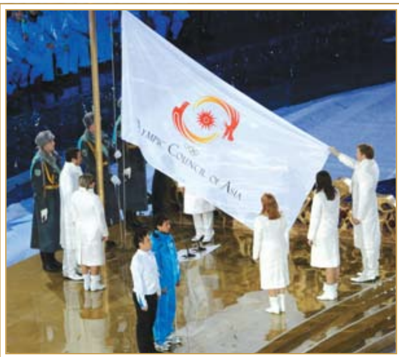
Азиада. Церемония открытия. Астана, 30 января 2011 года

гостей на Азиаду прибыло около 4,5 тысяч человек. Хозяева соревнований выставили 167 спортсменов – перед ними стояла задача, войти в тройку лидеров в командном зачете. Главными конкурентами Казахстана были сборные Китая, Южной Кореи и Монголии.