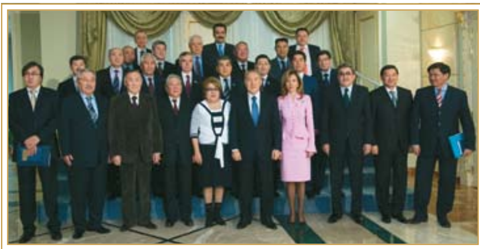
Завершение работы Комитета по демократизации. Астана, 19 февраля 2007 года