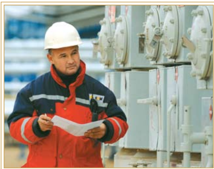
Развитие нефтегазовой промышленности. Мангистауская область, ноябрь 2009 года