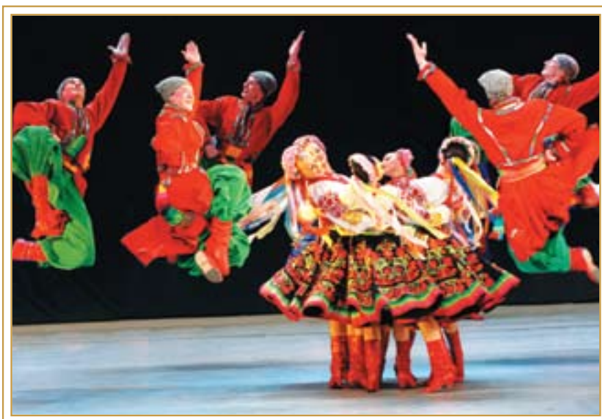
Год Украины в Казахстане – заключительный концерт. Астана, 20 декабря 2008 года

ния. Кроме того, китайский ресторан расположился и на 23-м вращающемся этаже. В отеле 153 номера, в том числе президентский люкс и пять VIP-номеров. К услугам посетителей тренажерный зал, бассейн, подземная автостоянка. «Пекин Палас» был построен на средства китайских инвесторов. Общая стоимость комплекса составила более $100 млн.