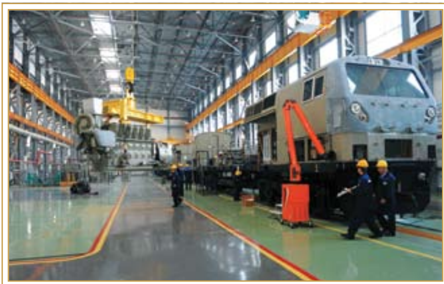
Локомотивостроительный завод. Астана, 8 декабря 2009 года