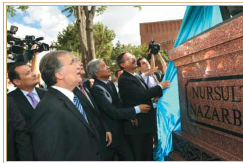
Памятник Н. Назарбаеву. Анкара (Турция), 24 июня 2010 года