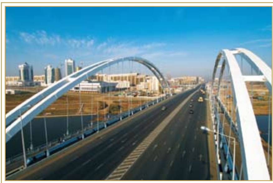
Новый мост Астаны. Декабрь 2008 года