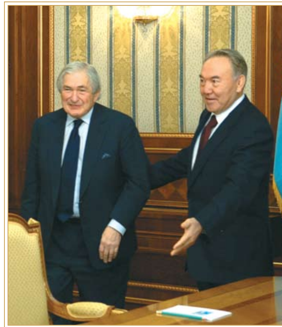
Президент Республики Казахстан Н.А. Назарбаев с президентом Всемирного Банка. Астана, 9 февраля 2007 года