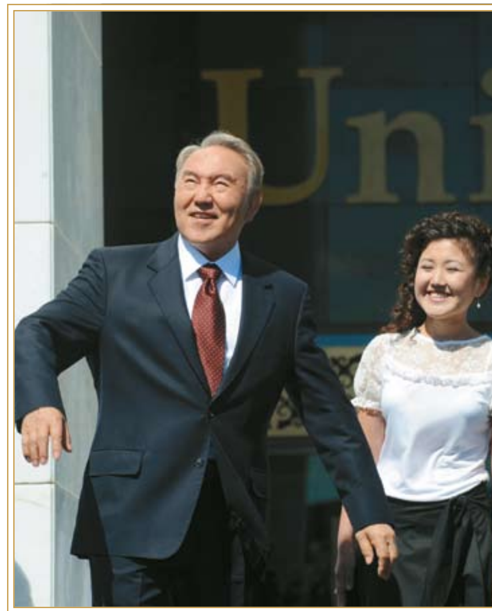
Открытие «Назарбаев Университета». Астана, 28 июня 2010 года