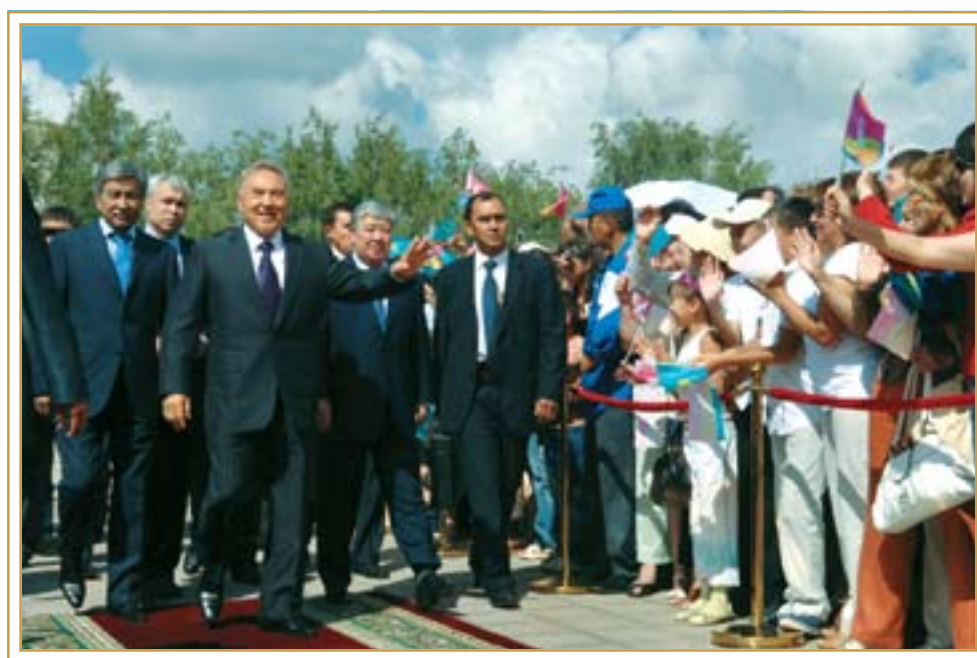
Дан старт празднованию 10-летнего юбилея Астаны, июль 2008 года