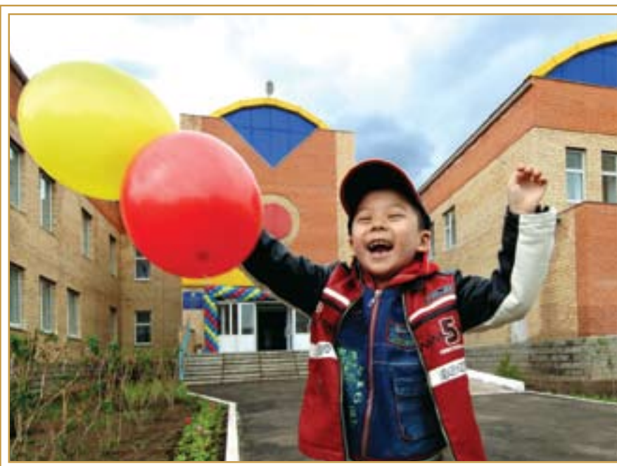
Открытие нового детского сада. Астана, 15 мая 2006 года