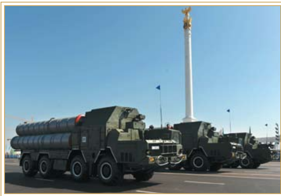
Мощь боевой техники на военном параде. Астана, 30 августа 2010 года