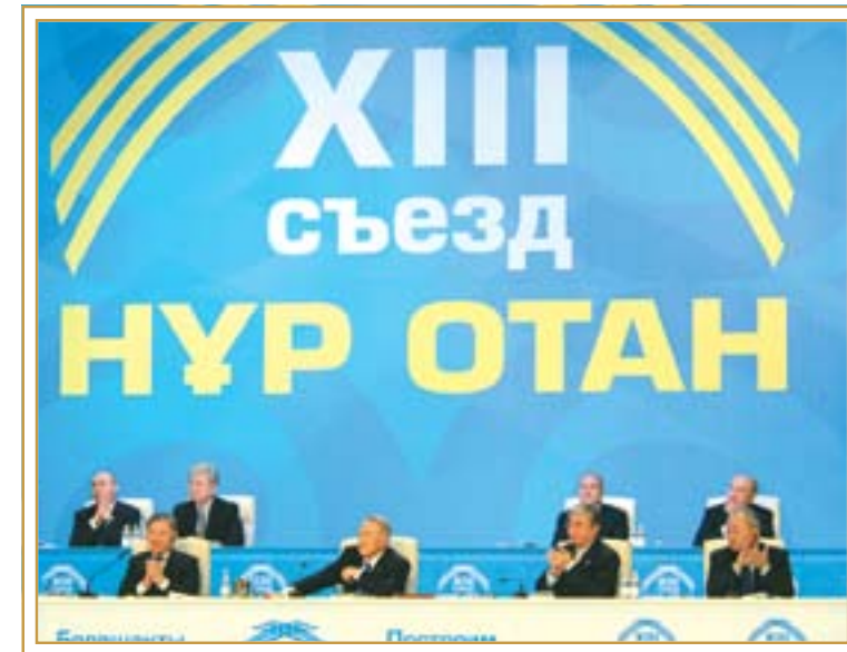
13-й Съезд НДП «Нур Отан». Астана, 11 февраля 2011 года

О своих программах финансовой поддержки рассказали и представители финансовых институтов развития – АО «КазАгроФинанс» и «Фонд финансовой поддержки сельского хозяйства». Работники филиалов банков второго уровня, активно участвующие в реализации «ДКБ 2020», ответили на вопросы, касающиеся финансирования