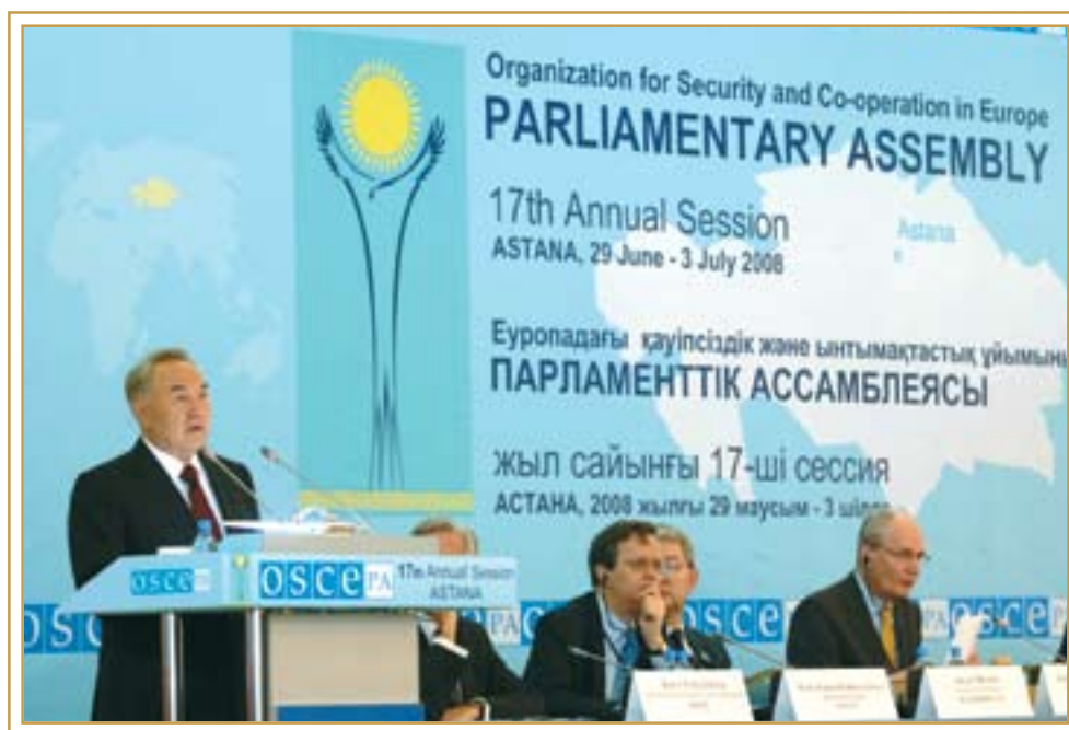
17-я сессия Парламентской ассамблеи ОБСЕ. Астана, 29 июня 2008 года