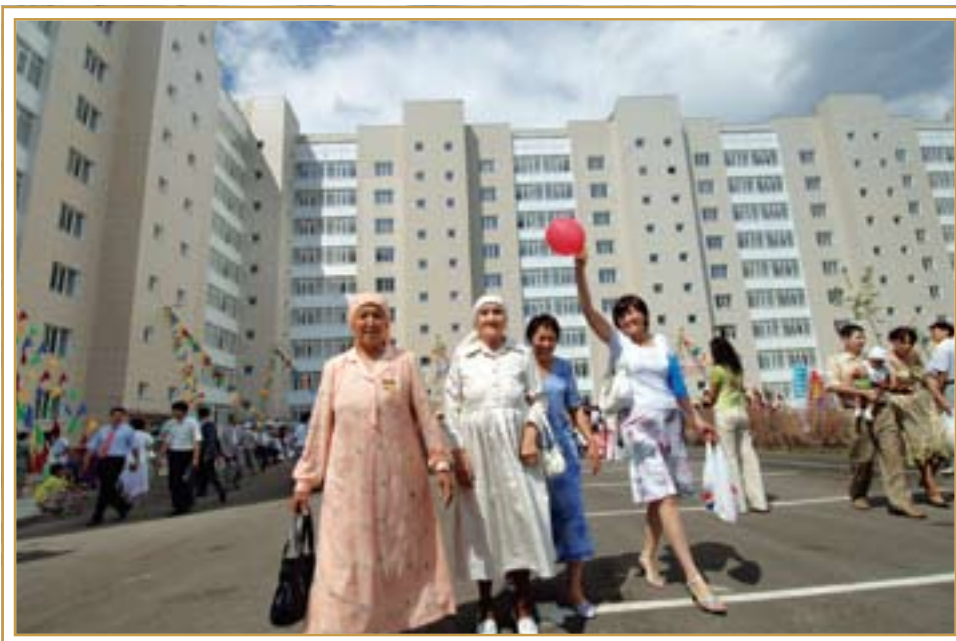
Новый жилой комплекс сдан в эксплуатацию по государственной программе жилищного строительства. Астана, июль 2006 года