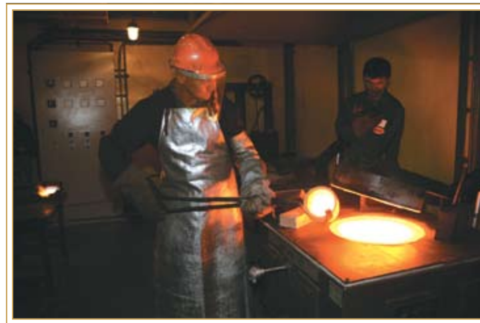
Первый результат. Январь 2007 года