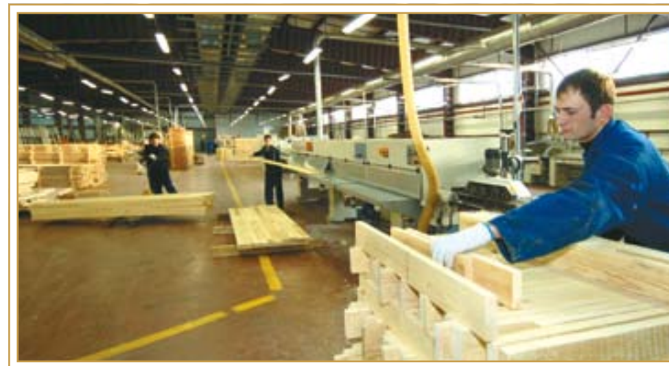
Цех завода «Шебер» в действии Астана, январь 2007 года