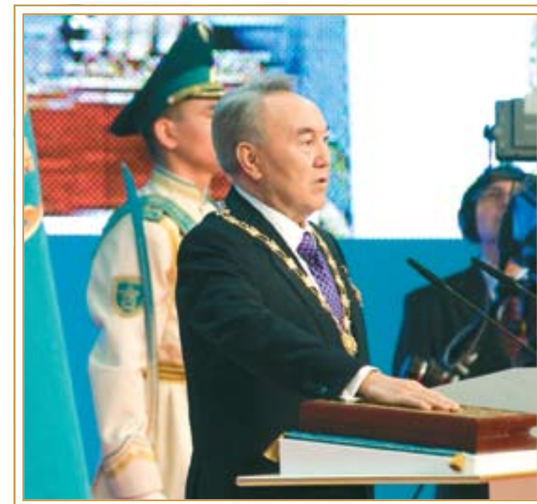
Инаугурация Президента РК. Астана, 8 апреля 2011 года