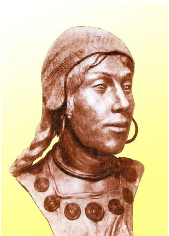
3-сурет: Батыс Қазақстан өңірінің қола дәуіріне жататын әйел адамның бас антропологиялық қалпына келтірілген мүсіні