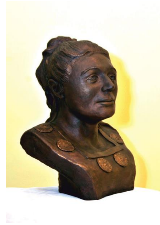
2-сурет: Солтүстік Қазақстан өңірінің қола дәуіріне жататын Алексеевка қонысынан табылған әйел адамның бас сүйегі арқылы антропологиялық қалпына келтірілген мүсіні