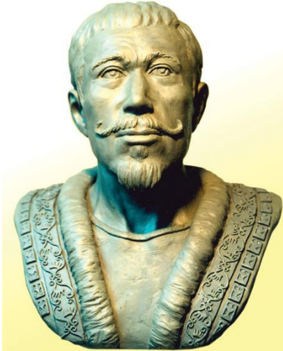
5-сурет: Шығыс Қазақстан өңірінің ежелгі темір дәуіріне жататын Берел қорымынан қазып алынған ер адамның бас сүйегі арқылы антропологиялық қалпына келтірілген мүсіні.