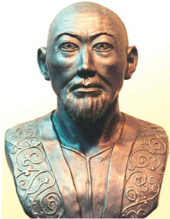
9-сурет: Орталық Қазақстан жерінде ортағасыр дәуіріне жататын Алаша хан атты кесенеден қазып алынған ер адамның бас сүйегі арқылы антропологиялық қалпына келтірілген мүсіні.