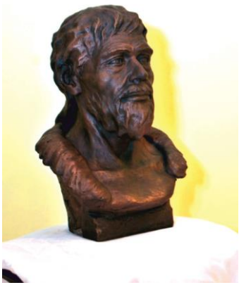
1-сурет: Маңғыстау өңірінің неолит дәуіріне (бұдан 7-5 мың жыл бұрын) жататын ер адамның бас сүйегі бойыша антропологиялық әдістеме арқылы қалпына келтірілген мүсін көрінісі.