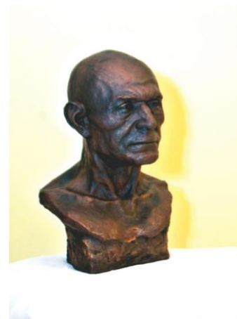
4-сурет: Жетісу өңірінің ежелгі темір дәуіріне жататын ер адамның бас сүйегі арқылы антропологиялық қалпына келтірілген мүсіні.