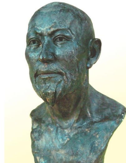
8-сурет: Тянь-Шань өңірінің түркі дәуіріне жататын ер адамның бас сүйегі арқылы антропологиялық қалпына келтірілген мүсіні.