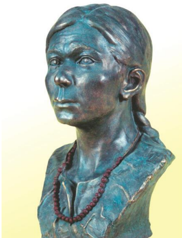
7-сурет: Батыс Қазақстан өңірінің антикалық дәуіріне жататын әйел адамның бас сүйегі арқылы антропологиялық қалпына келтірілген мүсіні.